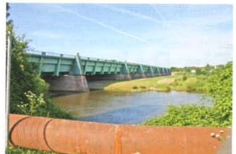
Baustellenambiente: Der Mittellandkanal kreuzt in Minden die Weser.

Nach kurzer Zeit – die Abdichtung mit dem Harz hat nach dem Vorarbeiten gerade einmal eine halbe Stunde gedauert – ist die Anbindung fertig. Fischer ist zufrieden mit seiner Arbeit und angetan von der Verarbeitung des Epoxidharzes, Bauleiter Höppner, der sich das fertige Projekt ansieht, ist beeindruckt. Und die Optik? Im leuchtend blauen PE und vor dem hellen GFK-Rohr setzt das rote Harz8 einen tollen Akzent. Nun ist es am Harz8, das im Langzeittest bereits über 1000 Stunden PE-Abdichtung absolviert hat, sich in der Praxis zu bewähren. Neben den Städtischen Betrieben Minden und dem re-sinnovation Team sind auch zahlreiche Akteure aus der Kanalsanierung gespannt, wie Harz8 mit dieser Herausforderung fertig wird. ■